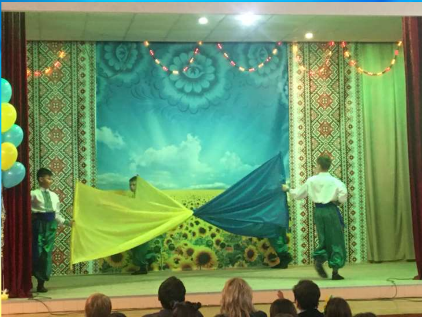
Початок заходу – флешмоб учнів 6-их класів.